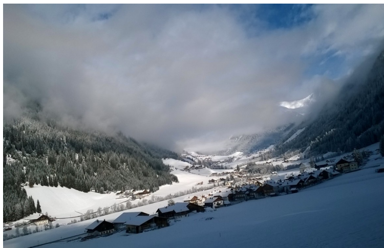
Valle di Casies