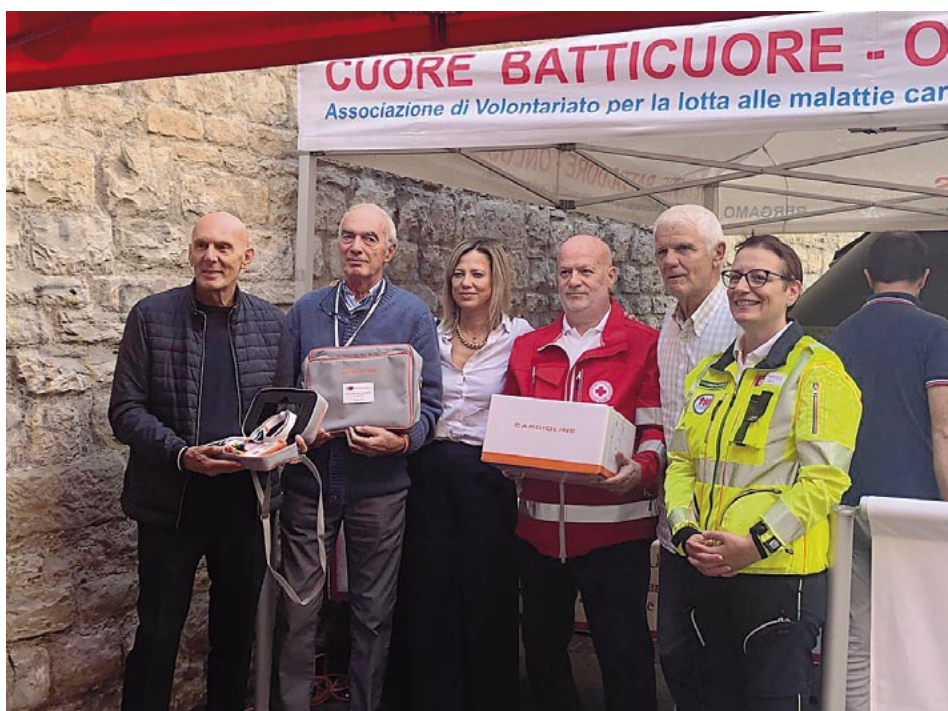
La donazione degli elettrocardiografi