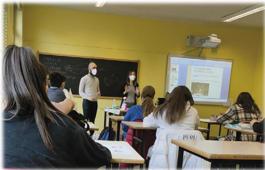
L'infermiere e la psicologa durante una lezione

Nell'istituto scolastico nel quale si sta implementando il progetto "La salute a Scuola" (che si ricorda ai lettori è un progetto finanziato da Cuore Batticu-