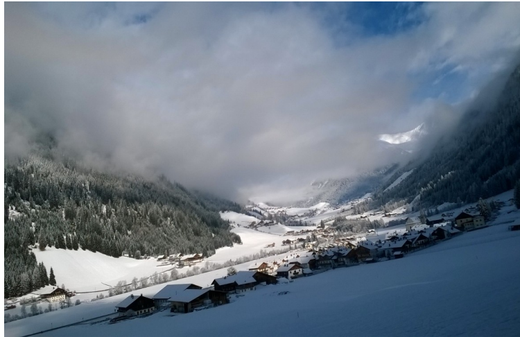
Valle di Casies